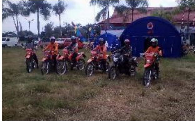
Pemadaman Karhutla di Kab. Pulang Pisau