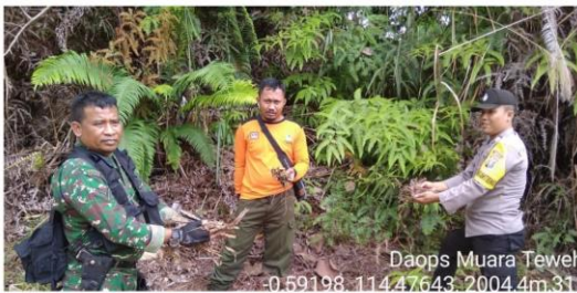
Patroli dan Sosialisasi Penanganan Karhutla di Wil. Kodim 1013/Mtw

Daops Muara Teweih 0.59198, 114,47643, 2004,4m, 331"