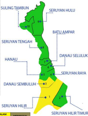
Keterangan warna Peta