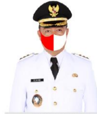
YULHAIDIR Bupati Seruyan Sekelua Ketua Gugus Tugas Pemangaman Covid-19 Kabupaten Seruyan