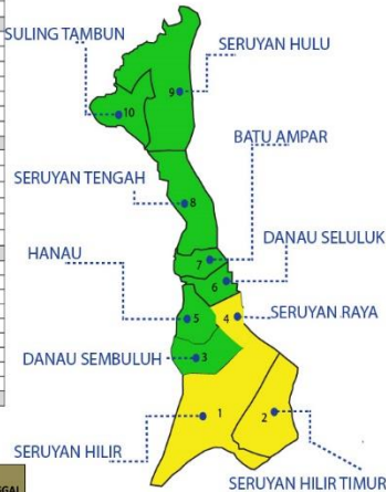
Keterangan warna Peta