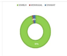
PERSENTASE KONDISI PASIEN COVID-19 KABUPATEN SERUYAN

sumber data : Media Center Satuan Tugas Seruyan