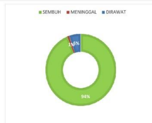
PERSENTASE KONDISI PASIEN COVID-19 KABUPATEN SERUYAN