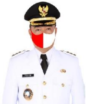
YULHAIDIR Bupati Seruyan Salaku Ketua Gugus Tugas Penanganan Covid-19 Kabupaten Seruyan

SULING TAMBUN SUSPEK = 0 KONFIRMASI = 0 SEMBUH = 0 MENINGGAL = 0