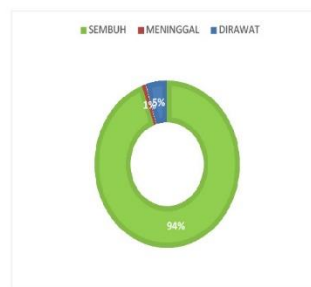
PERSENTASE KONDISI PASIEN COVID-19 KABUPATEN SERUYAN

sumber data : Media Center Satuan Tugas Seruyan