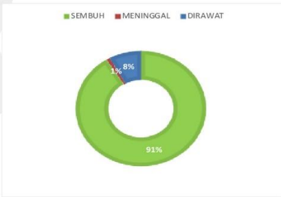
PERSENTASE KONDISI PASIEN COVID-19 KABUPATEN SERUYAN

sumber data : Media Center Satuan Tugas Seruyan