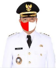
YULHAIDIR Bupati Seruyan Satuan Ketua Gugus Tugas Penanganan Covid-19 Kabupaten Seruyan