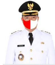
YULHAIDIR Bupati Seruyan Sekeloa Ketaw Gugen Tugan Penanganan Covid-19 Kabupaten Seruyan