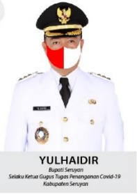
YULHAIDIR Bupati Seruyan Sekeloa Ketar Gugus Tugas Penanganan Covid-19 Kabupaten Seruyan