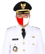
YULHAIDIR Bupati Seruyan Sekeloa Satgas Gugus Tugas Penanganan Covid-19 Kabupaten Seruyan