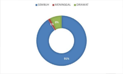
PERSENTASE KONDISI PASIEN COVID-19 KABUPATEN SERUYAN