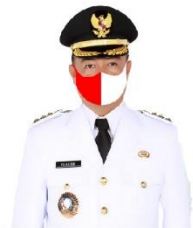
YULHAIDIR Bupati Seruyan Sekeloa Satgas Gugus Tugas Penanganan Covid-19 Kabupaten Seruyan