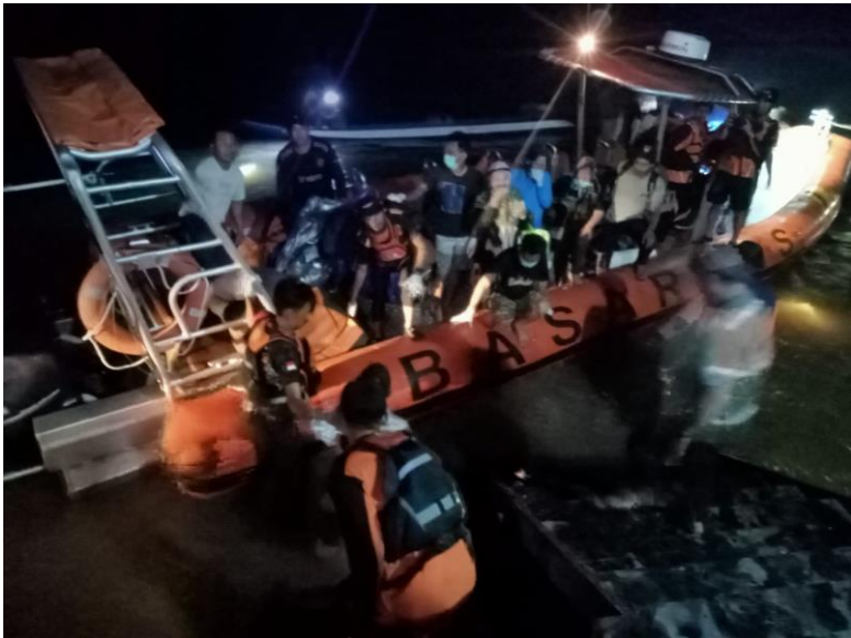
Dokumentasi kejadian Tenggelam di kab. Bulungan