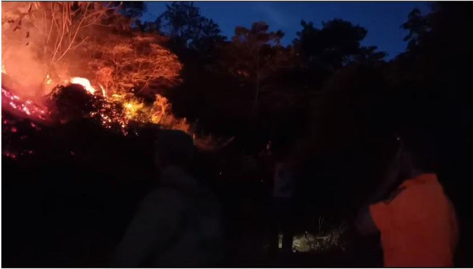
Dokumentasi KARHUTLA di Kab. Nunukan