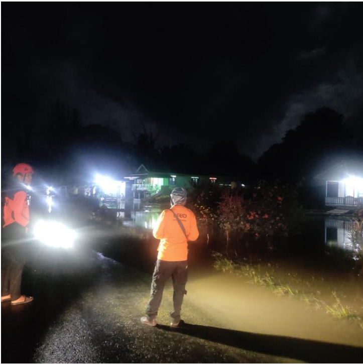
Dokumentasi Banjir di Kab. Bulungan