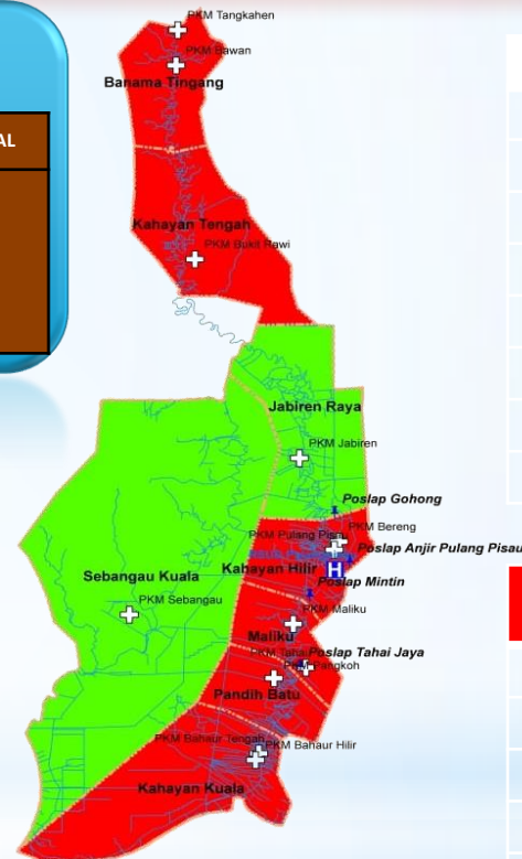
Data Zona Peta Sebaran Kasus Covid – 19 Kabupaten Pulang Pisau Dari Tanggal 17 Maret s/d 17 Juni 2020