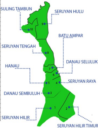
Keterangan warna Peta