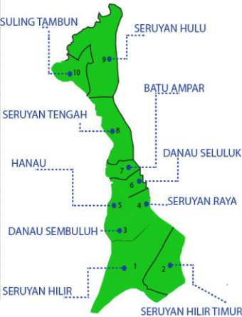
Keterangan warna Peta