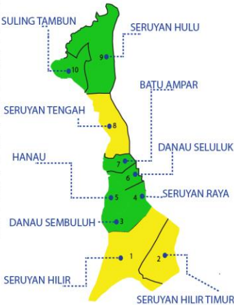
Keterangan warna Peta