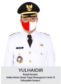
YULHAIDIR Bupati Seruyan Setahu Ketua Satuan Tugas Penanganan Covid-19 Kabupaten Seruyan