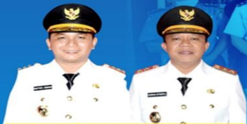
BAKHTIAR AHMAD SIBARANI BUPATI TAPANULI TENGAH

UPDATE DATA PASIEN PADA TANGGAL 27 APRIL 2020