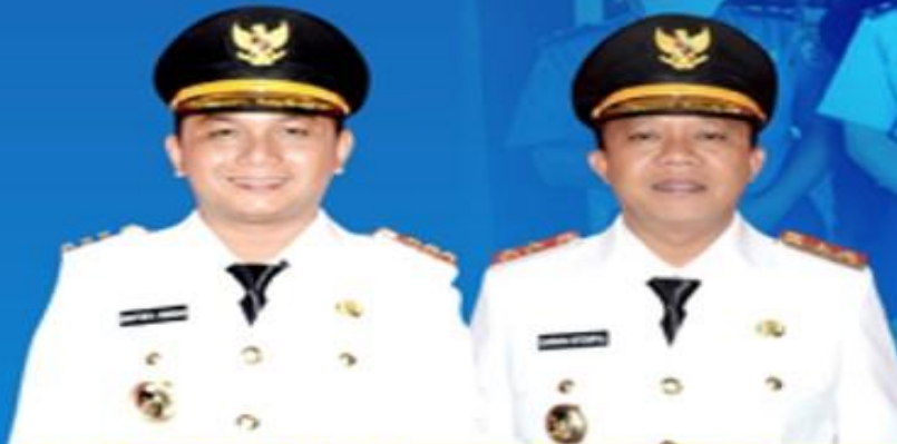
BAKHTIAR AHMAD SIBARANI BUPATI TAPANULI TENGAH

UPDATE DATA PASIEN PADA TANGGAL 19 APRIL 2020